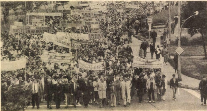
Ezrek vonultak fel a nagygyűlésre.

lőre összegöngyölve. Három óra után kinyílnak a zászlók, táblák emelkednek a magasba.